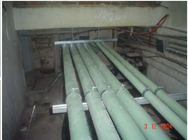
CANALIZACIÓN PARA EL CAMBIO DE ACOMETIDA ELÉCTRICA