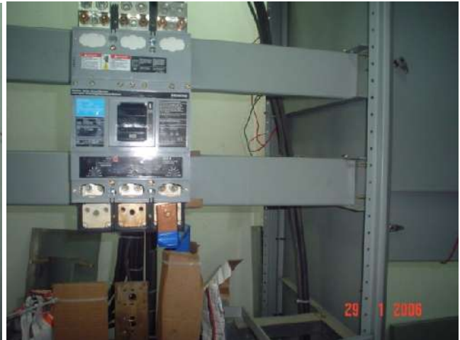
ADAPTACIÓN DE INTERRUPTOR DERIVADO SIN CORTE DE ENERGÍA ELÉCTRICA