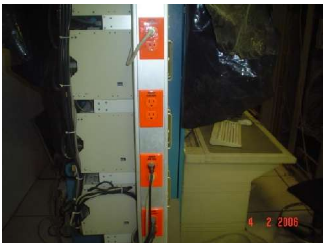
SUMINISTRO Y COLOCACIÓN DE CANALETA DE ALUMINIO