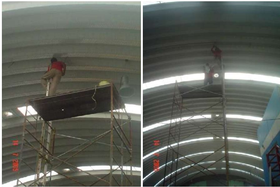
ALUMBRADO PARA NAVES INDUSTRIALES