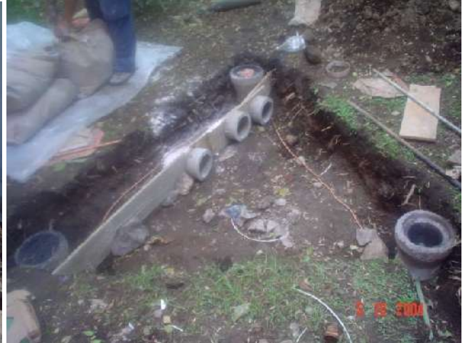
SISTEMA DE TIERRAS FÍSICAS EN CONEXIÓN DELTA