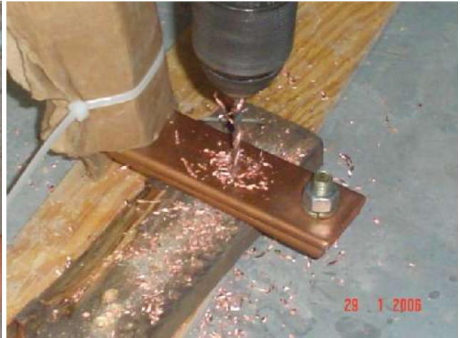
ADAPTACIÓN DE INTERRUPTOR DERIVADO SIN CORTE DE ENERGÍA ELÉCTRICA