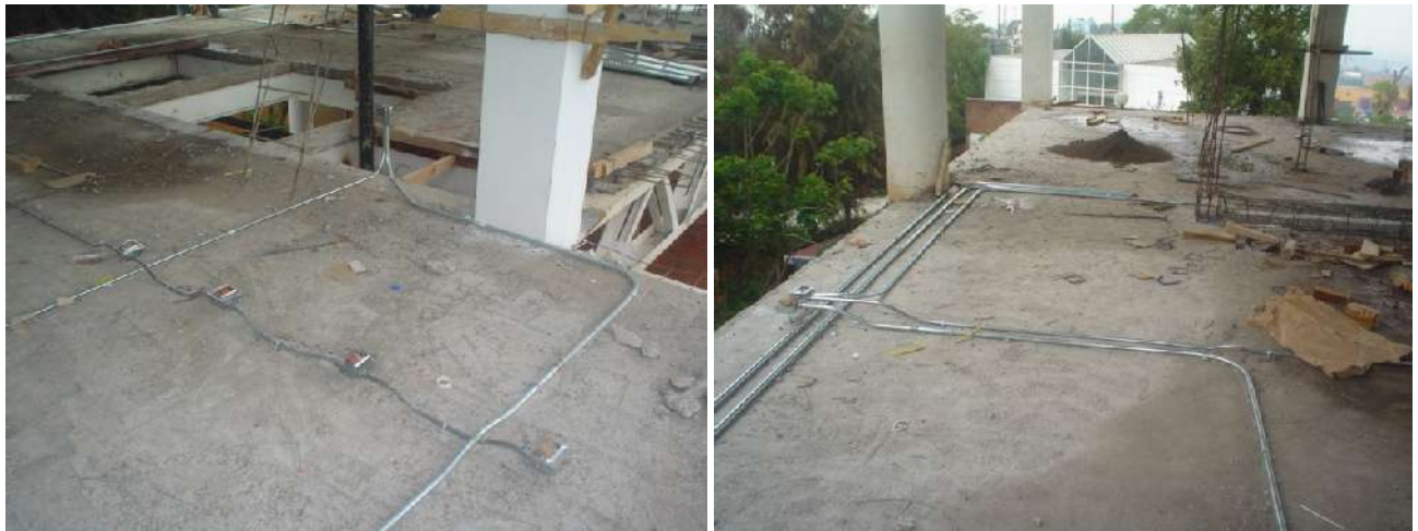
CANALIZACIÓN PARA CONTACTOS (TENSIÓN NORMAL Y REGULADA)