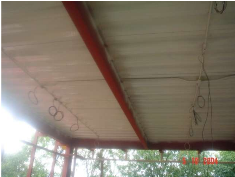
CANALIZACIÓN Y CABLEADO DE ALUMBRADO