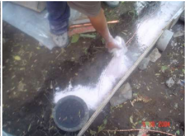
QUIMICOS EN SISTEMA DE TIERRAS FÍSICAS