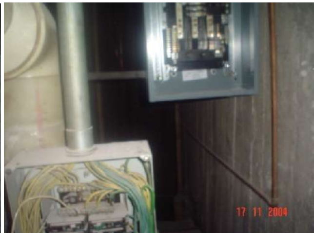
CAMBIO EN TABLEROS DE DISTRIBUCIÓN