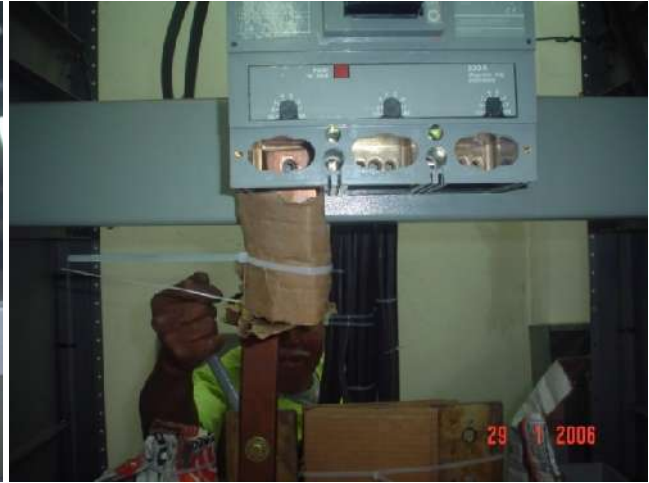
ADAPTACIÓN DE INTERRUPTOR DERIVADO SIN CORTE DE ENERGÍA ELÉCTRICA