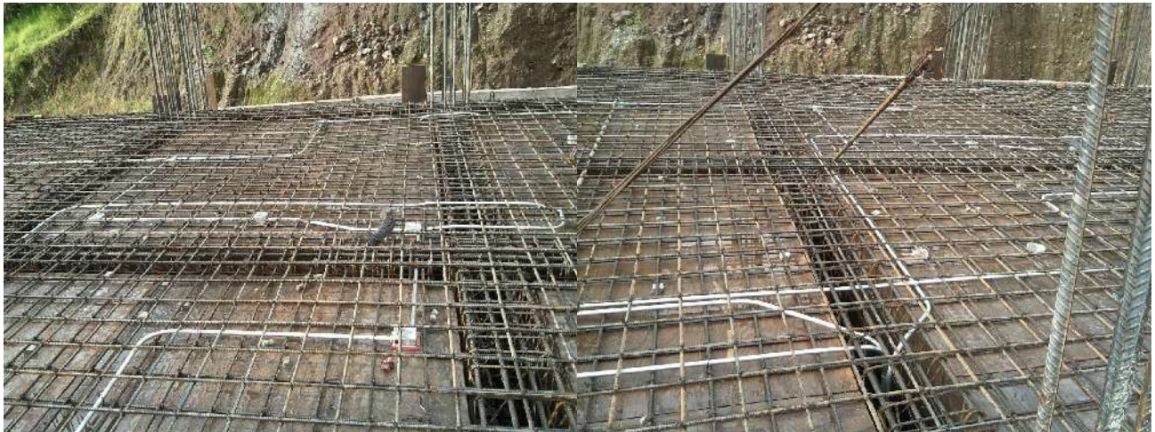
INSTALACIÓN ELÉCTRICA EN LOSA ARMADA