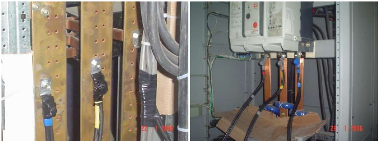
CONEXIÓN DE PUESTOS PARA MANIOBRAS SIN CORTE DE ENERGÍA ELÉCTRICA