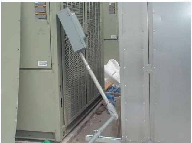
CONEXIÓN DE EQUIPOS DE AIRE ACONDICIONADO