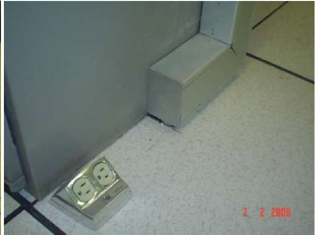
INSTALACIÓN EN PISO FALSO