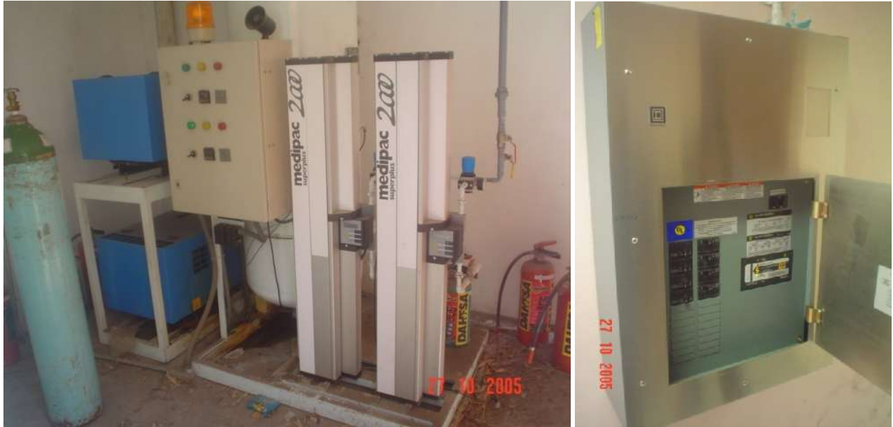
SUMINISTRO, COLOCACIÓN Y CONEXIÓN DE EQUIPOS PARA CLINICAS Y HOSPITALES