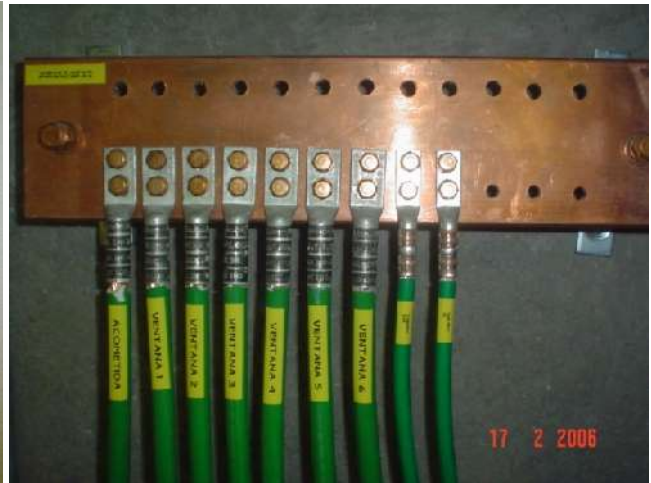
SISTEMA DE TIERRAS FISICAS PARA EQUIPOS DE TELECOMUNICACIONES