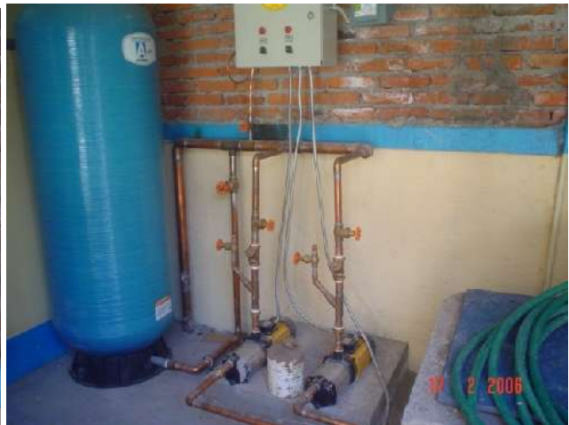
CONEXIÓN DE EQUIPOS HIDRONEUMÁTICOS