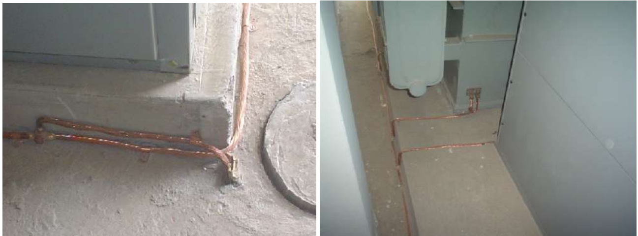
SISTEMA DE TIERRA FÍSICA EN SUBESTACIÓN ELÉCTRICA