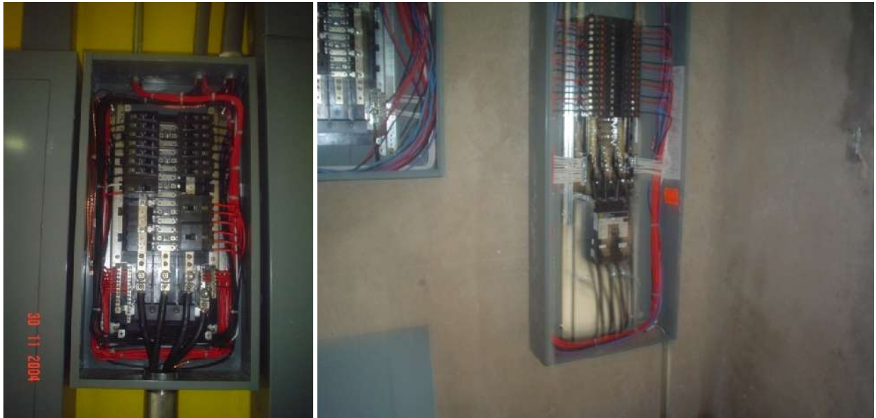
SUMINISTRO, INSTALACIÓN Y CONEXIÓN DE TABLEROS DE DISTRIBUCIÓN TIPO NQOD