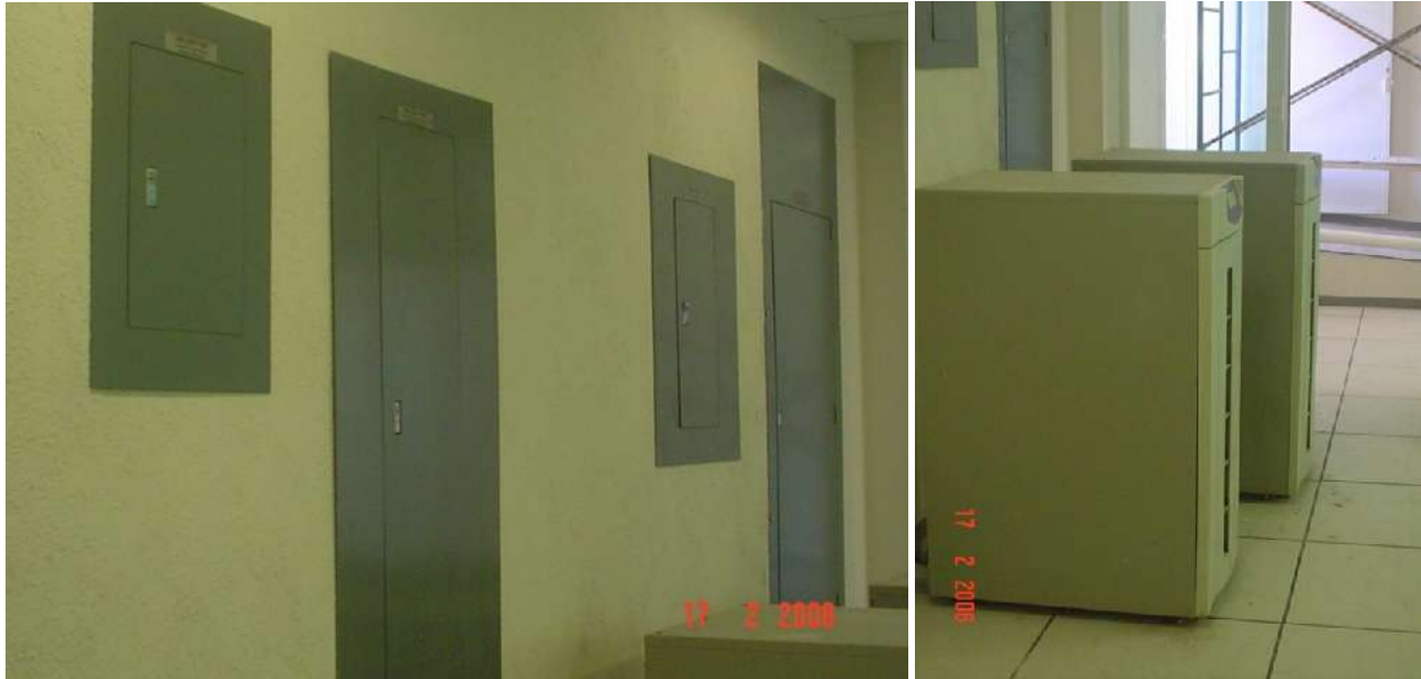
ARREGLO DE EQUIPOS DE DISTRIBUCIÓN DE ENERGÍA ELÉCTRICA