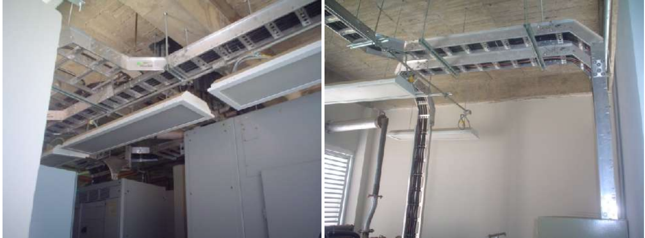
SUMINISTRO E INSTALACIÓN DE SOPORTE PARA CABLES DE ALUMINIO (CHAROLA)