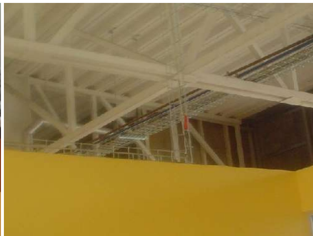
SUMINISTRO E INSTALACIÓN DE SOPORTE PARA CABLES DE MALLA ELECTROSOLDADA (CHAROFIL)