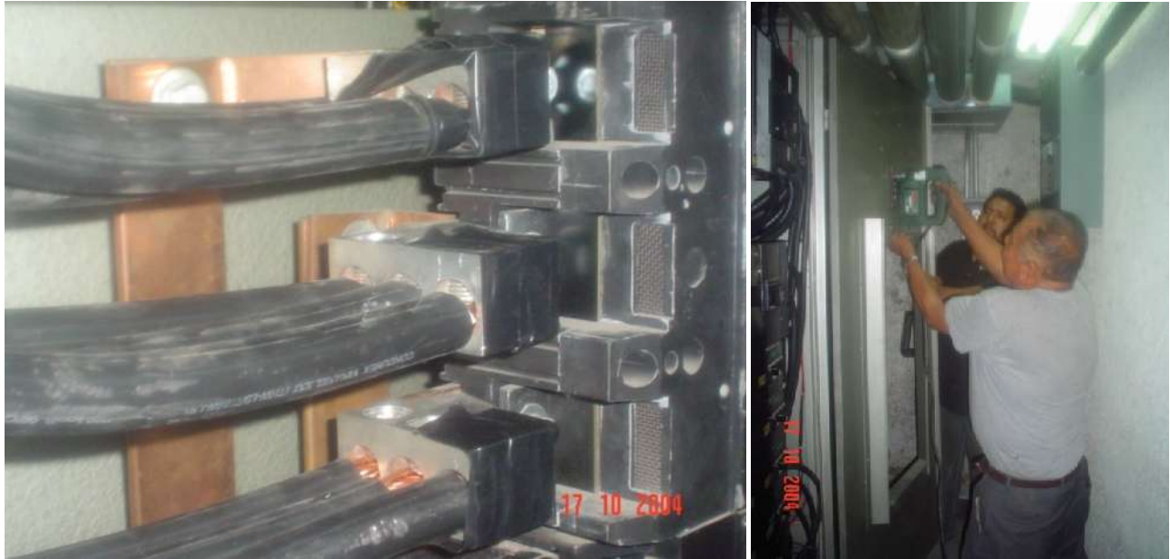
CAMBIO Y ADAPTACIÓN DE INTERRUPTORES PRINCIPALES