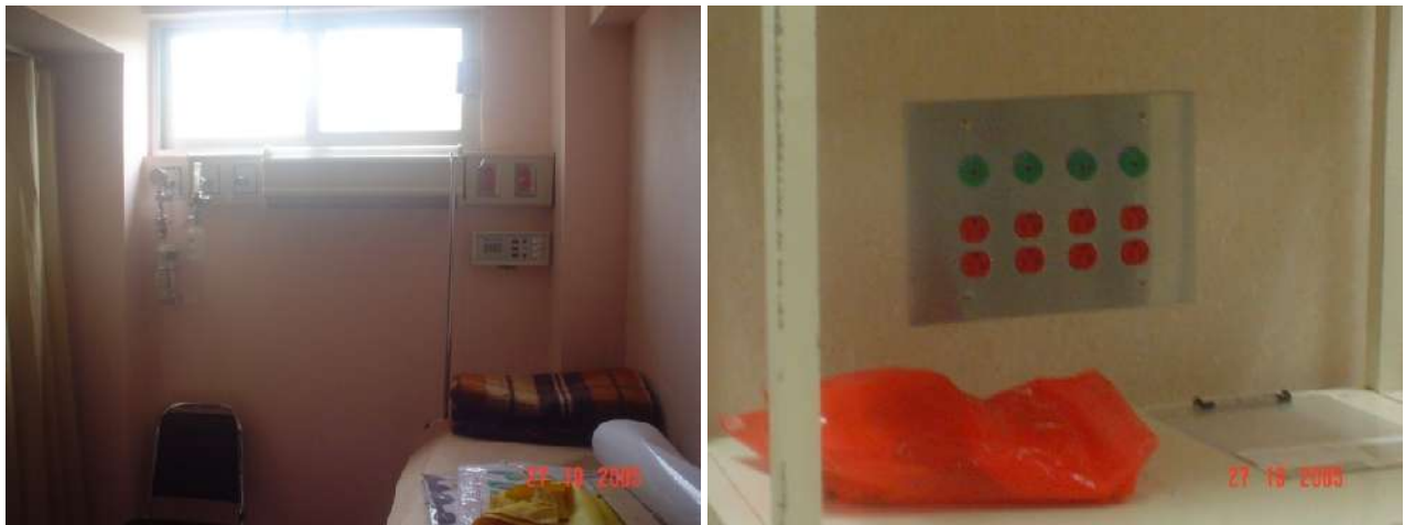
INSTALACIONES PARA CLINICAS Y HOSPITALES