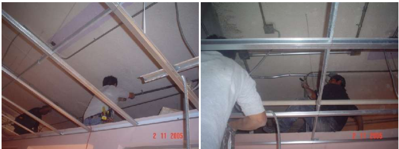
INSTALACIONES EN FALSO PLAFOND