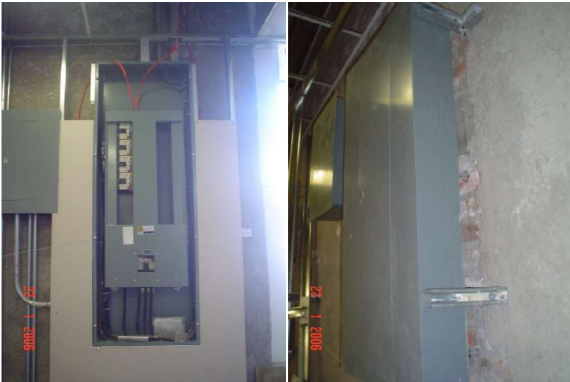
SUMINISTRO, COLOCACIÓN Y CONEXIÓN DE TABLERO DE DISTRIBUCIÓN TIPO I-LINE