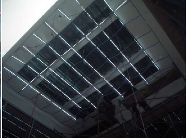
SUMINISTRO, COLOCACIÓN Y CONEXIÓN DE LUMINARIAS ESPECIALES