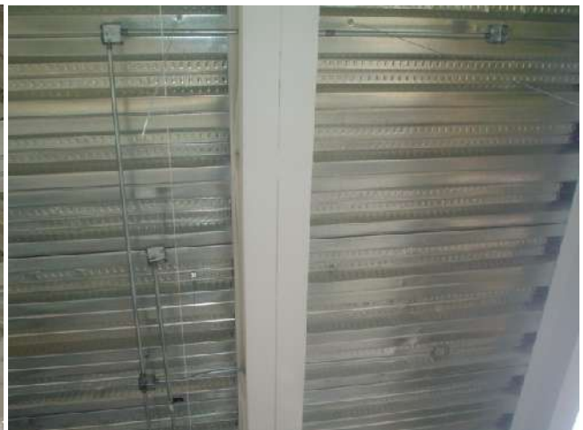
CANALIZACIÓN PARA ALUMBRADO