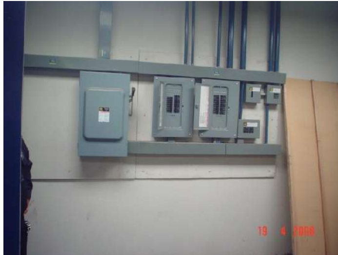
ARREGLO DE EQUIPOS ELECTRICOS CON DUCTO CUADRADO