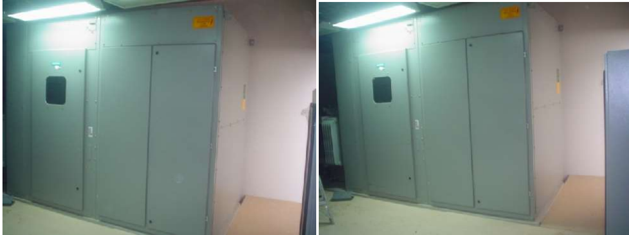
SUMINISTRO, COLOCACIÓN Y CONEXIÓN DE GABINETES DE SUBESTACIÓN ELÉCTRICA