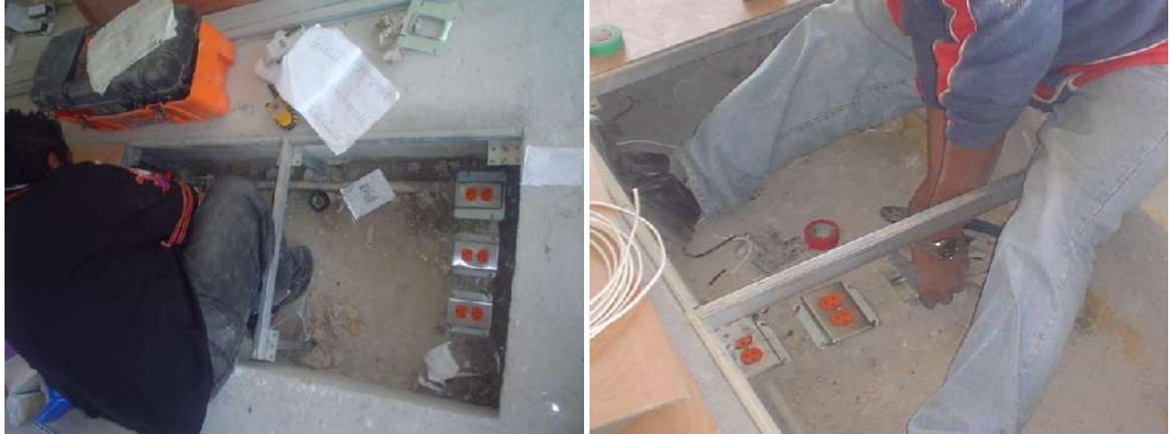
INSTALACIÓN EN PISO FALSO