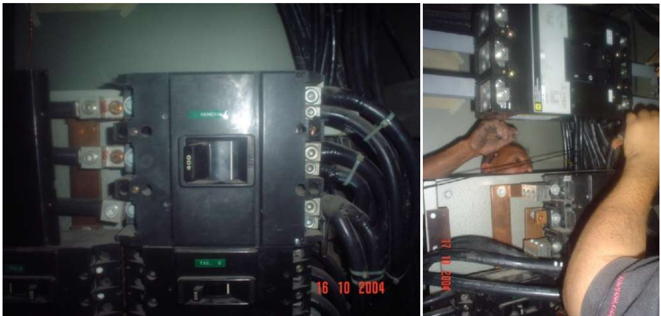
CAMBIO Y ADAPTACIÓN DE INTERRUPTORES PRINCIPALES