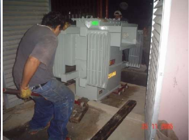
MANIOBRAS EB EQUIPOS PARA SUBESTACIÓN ELÉCTRICA