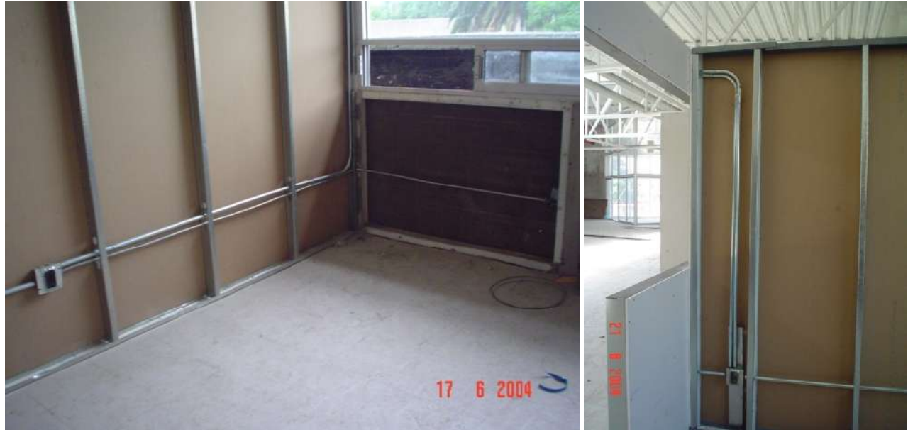
INSTALACIÓN EN MUROS FALSOS