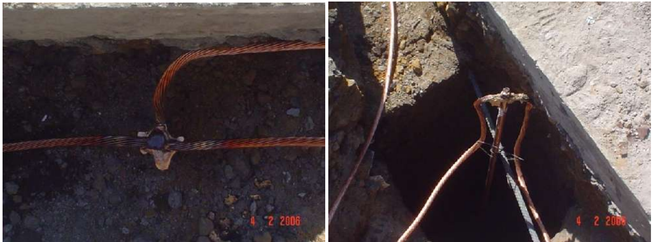
SISTEMA DE TIERRAS FISICAS CON CONEXIONES CADWELD