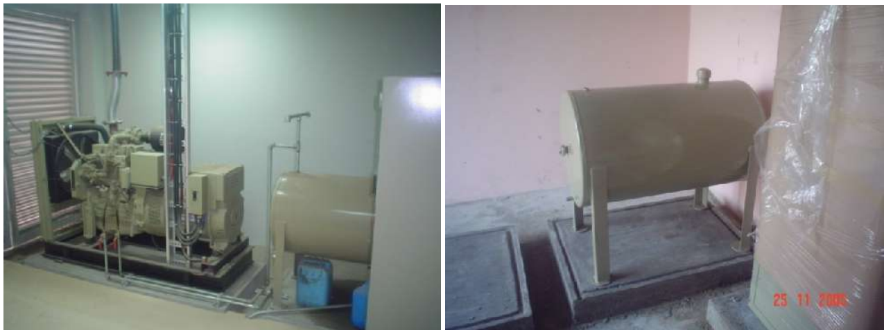
SUMINISTRO, COLOCACIÓN Y CONEXIÓN DE PLANTAS DE EMERGENCIA