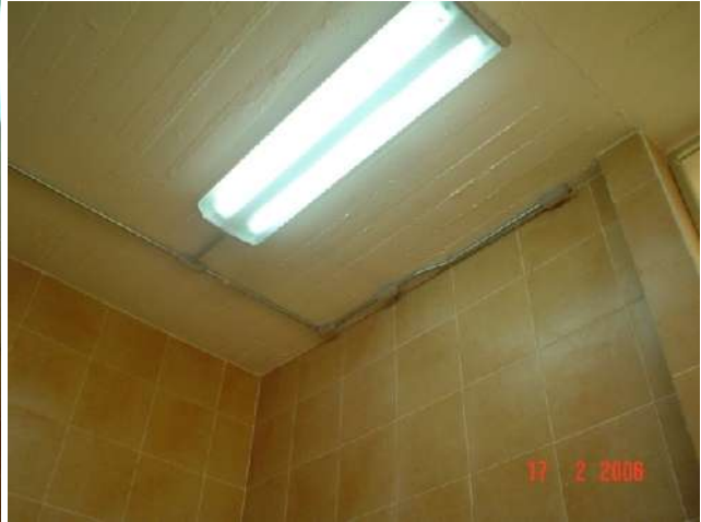
INSTALACIÓN DE ALUMBRADO