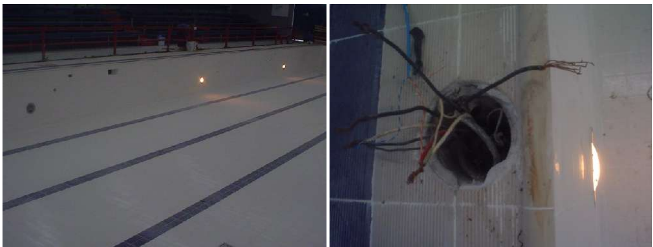
SUMINISTRO, INSTALACIÓN Y CONEXIÓN DE LUMINARIAS PARA ALBERCA