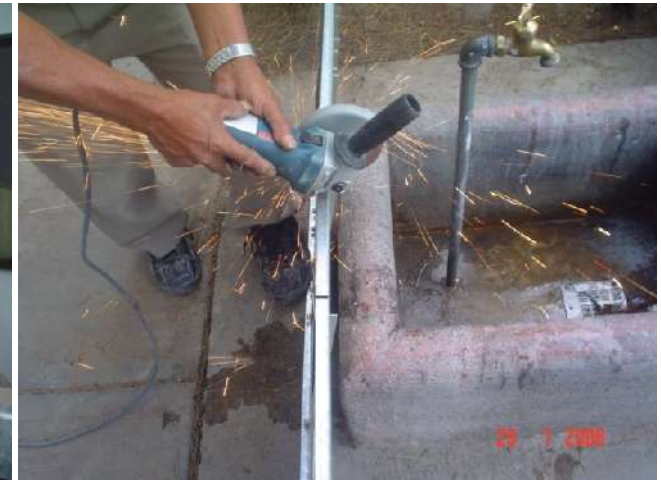
ADAPTACIÓN DE INTERRUPTOR DERIVADO SIN CORTE DE ENERGÍA ELÉCTRICA