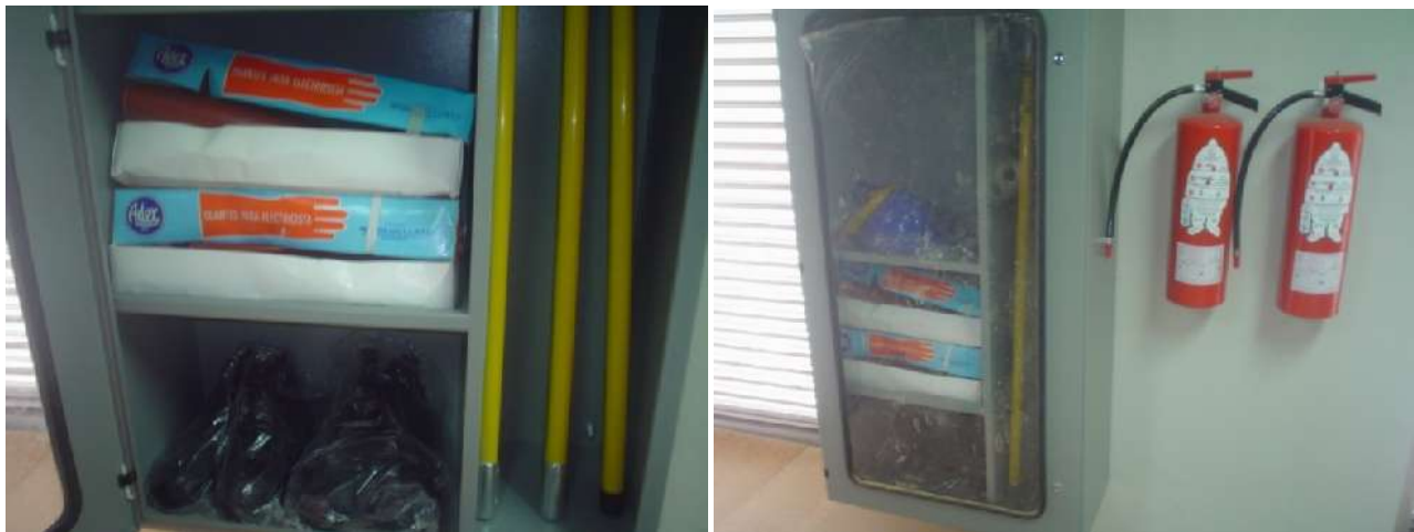
SUMINISTRO Y COLOCACIÓN DE EQUIPO DE SEGURIDAD