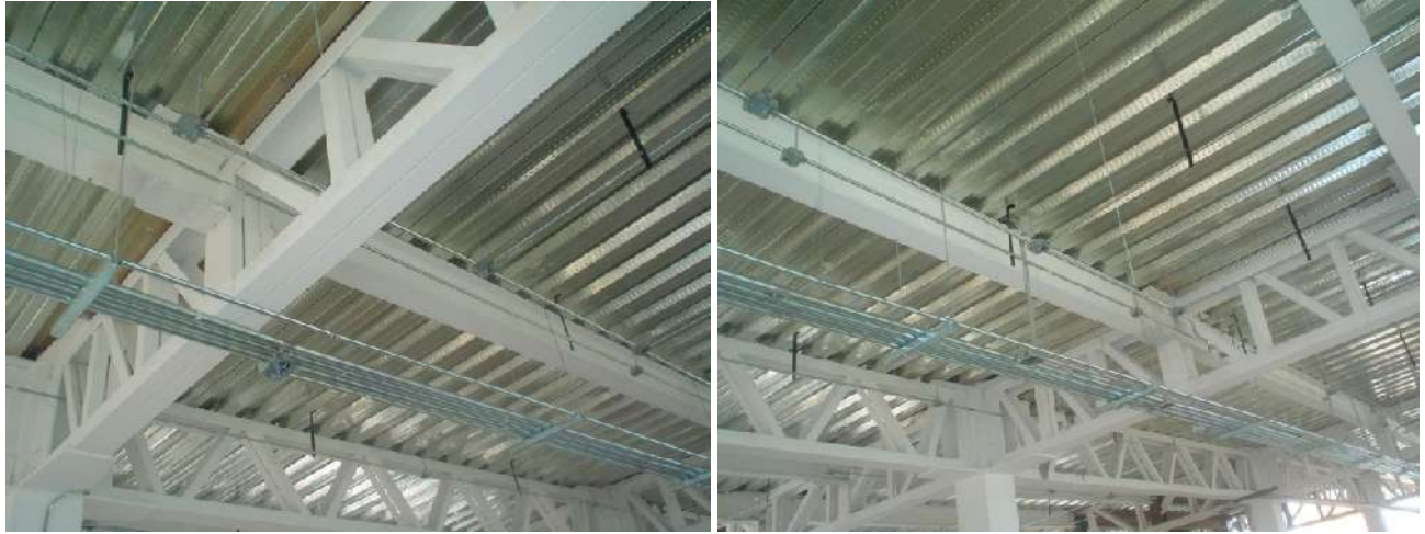
CANALIZACIÓN PARA ALIMENTADORES DE CIRCUITOS DERIVADOS