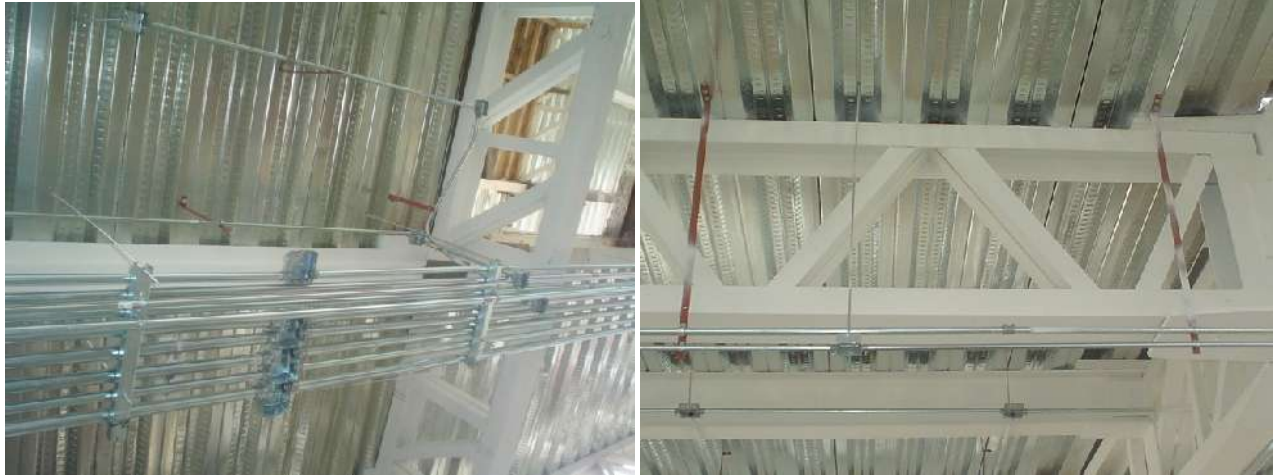
SOPORTES EN CANALIZACIONES