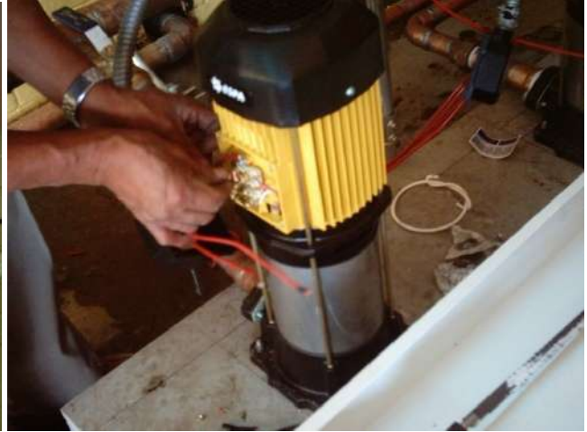
SUMINISTRO, COLOCACIÓN Y CONEXIÓN DE EQUIPO HIDRONEUMÁTICO