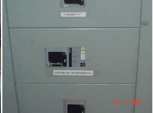
ADAPTACIÓN DE INTERRUPTOR DERIVADO SIN CORTE DE ENERGÍA ELÉCTRICA