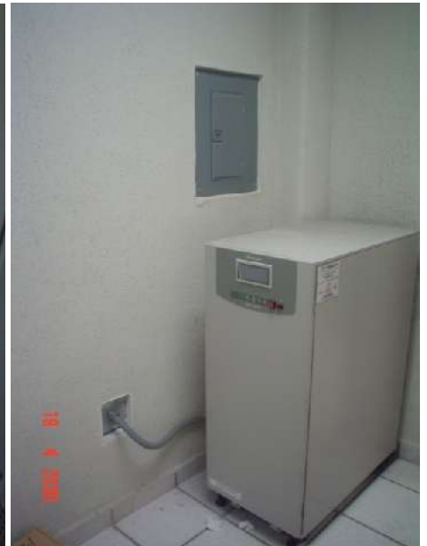
SUMINISTRO Y CONEXIÓN DE EQUIPOS REGULADORES Y DE RESPALDO DE ENERGÍA ELÉCTRICA