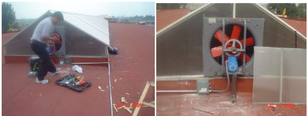
SUMINISTRO, INSTALACIÓN Y CONEXIÓN DE EXTRACTORES DE AIRE