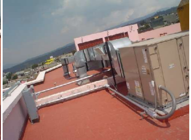
INSTALACIÓN Y CONEXIÓN PARA EQUIPOS DE AIRE ACONDICIONADO